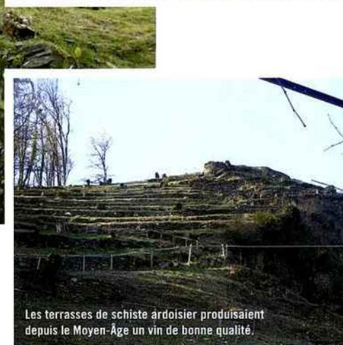
Les terrasses de schiste ardoisier produisaient depuis le Moyen-Âge un vin de bonne qualité.

Les coteaux de la Vézère, dont les terrasses de schiste ardoisier produisent un vin de bonne qualité, sont un emplacement très recherché. Source de richesse, la culture de la vigne sur ces pentes aménagées en terrasses est difficile et doit être effectuée manuellement, nécessitant une main-d'œuvre nombreuse. Cependant, en 1875, la culture de la vigne s'étend à toute la basse Corrèze : on estime à environ 17 000 ha la surface des vignobles sur l'ensemble du territoire.