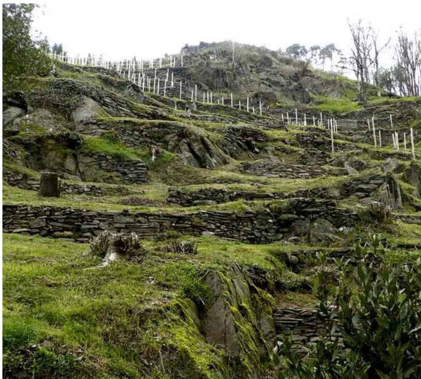
La relance d'un vignoble sur les territoires d'Allasac et de Voutezac est désormais à l'ordre du jour.